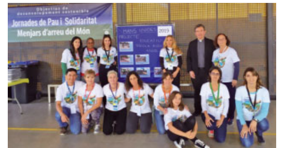
L'equip de Mans Unides - Castelldefels

Més recentment, al novembre, s'han portat a terme diverses «enceses solidàries d'espelmes» a les parròquies de Canyelles, Vilanova i la Geltrú, Sitges... L'acte s'emmarca en una activitat de Mans Unides a tota Espanya que porta com a títol «Encén el teu compromís» i que té com a objectiu crear un halo de llum virtual que il·lumini el món per acabar amb les «parts fosques» causades per la fam, les desigualtats i les injustícies que continuen existint. Gràcies a l'ajuda dels mossens i dels col·laboradors