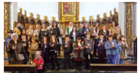
Encesa solidària a Sant Bartomeu i Santa Tecla de Sitges

a cada parròquia s'han pogut organitzar aquests actes i les col·lectes en benefici del projecte de promoció social i sanitària a La Guajira (Colòmbia), que vol afavorir l'accés a l'aigua potable en la zona.