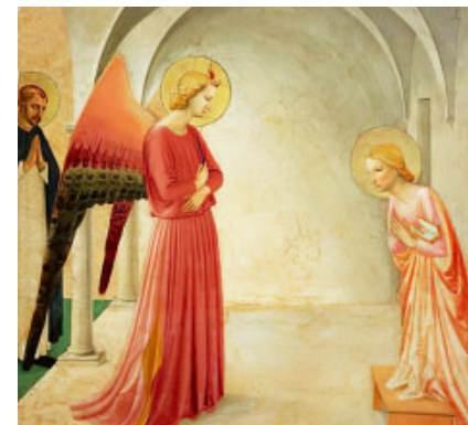
L'Anunciació (1442) de Fra Angelico. Museu de Sant Marc, Florència (Itàlia)